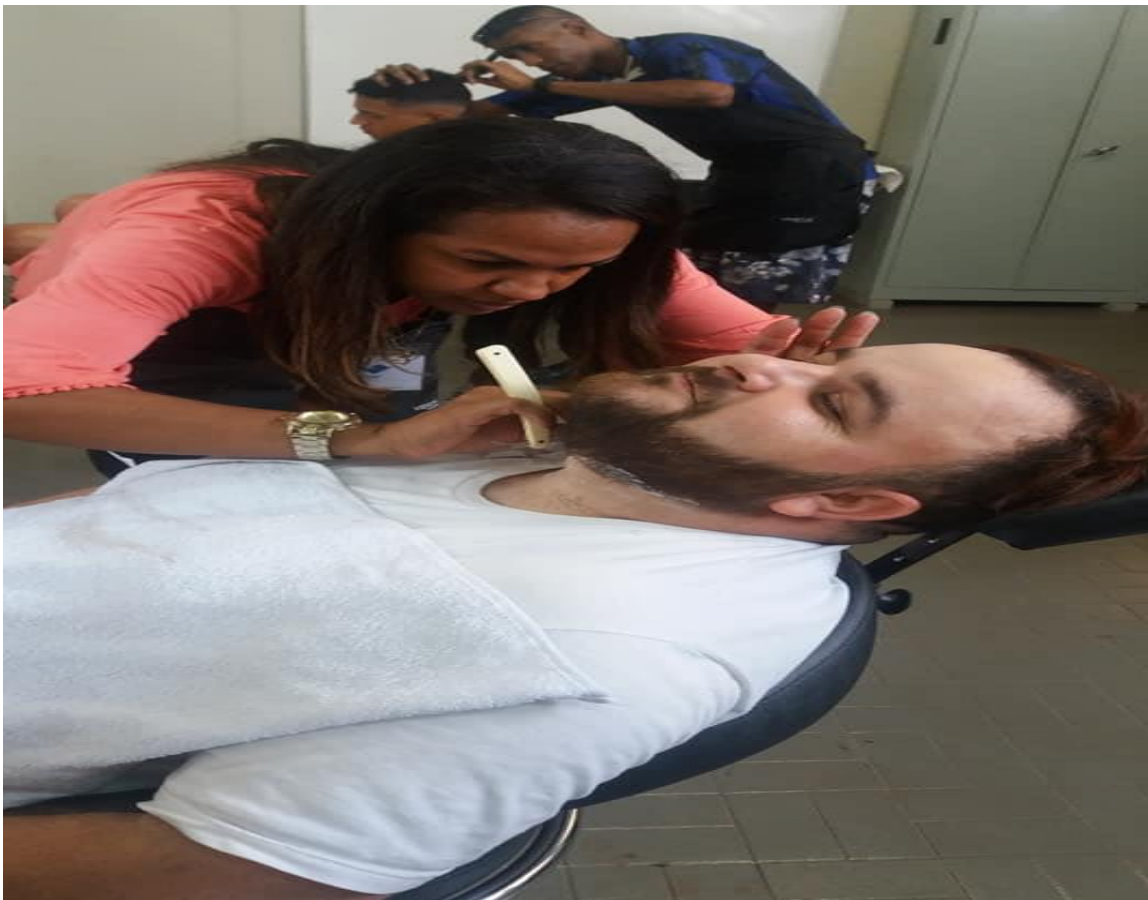
Curso de Barbeiro