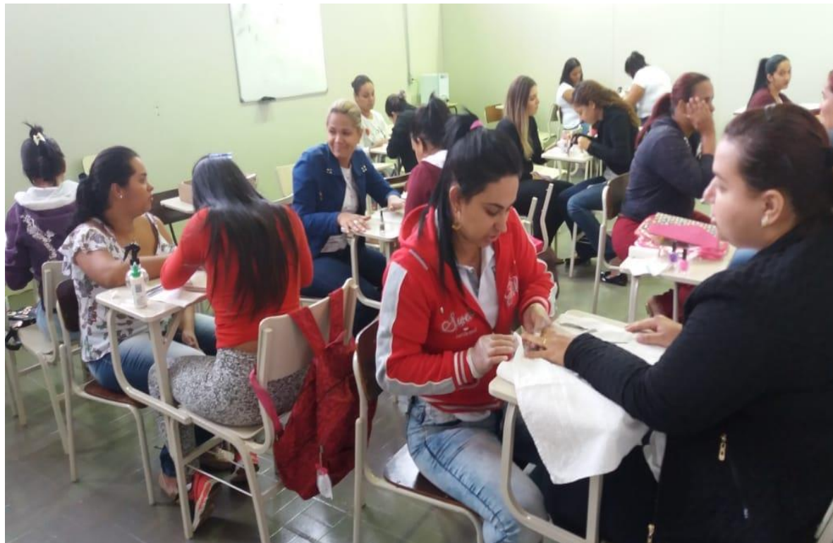
Alunas no Curso de Manicure e Pedicure

Fundação para o Desenvolvimento Educacional e Cultural da Alta Mogiana