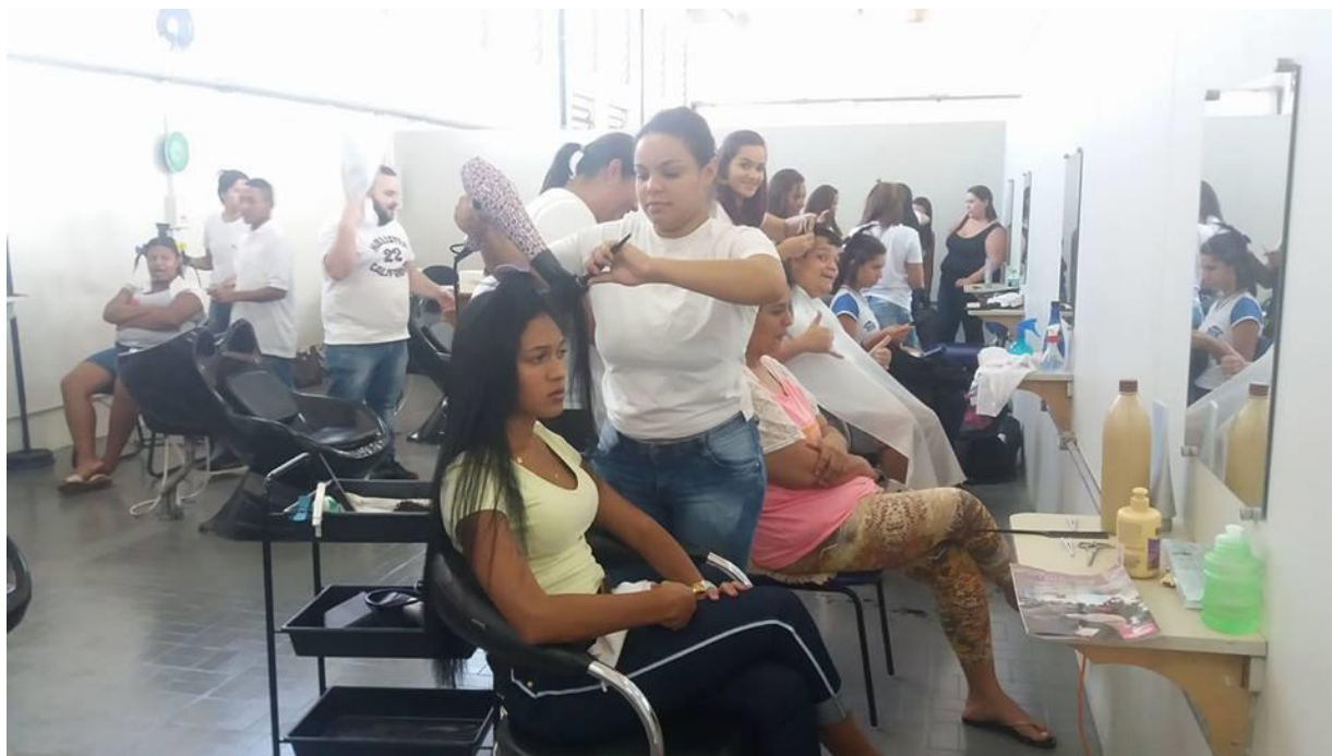
Alunos no Curso de Cabeleireiro