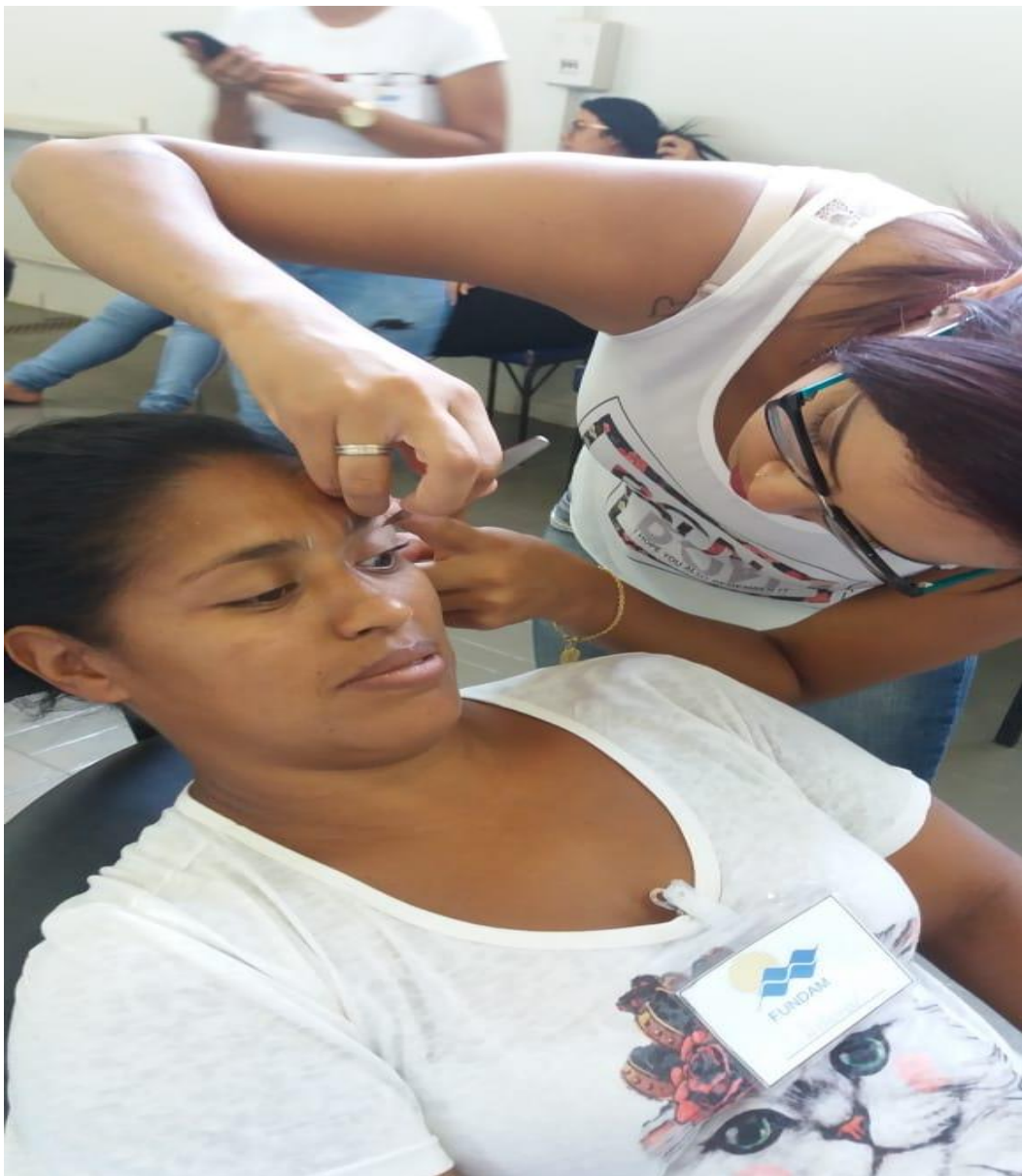
Curso de Design de Sobrancelhas.

Fundação para o Desenvolvimento Educacional e Cultural da Alta Mogiana