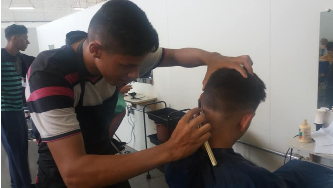
Curso de Barbeiro

Fundação para o Desenvolvimento Educacional e Cultural da Alta Mogiana